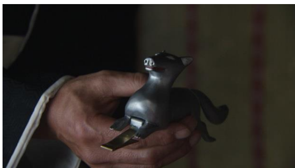
第13話で島津斉彬が篤姫に手渡した島津の守り神である“狐”の前立て（兜につける金物飾り）