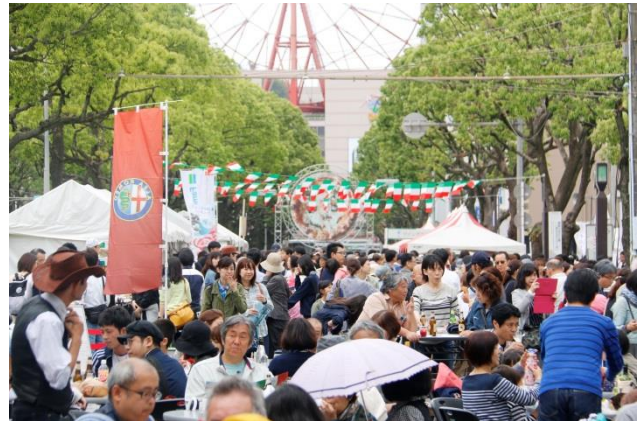
これまでの「かごしま風と光のナポリ祭」の様子