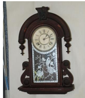
菊次郎愛用の時計