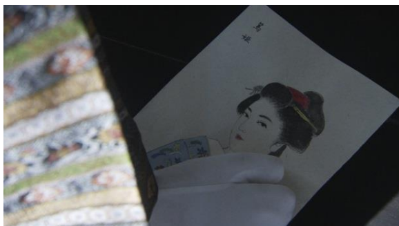
第12話で徳川家定が選んだ篤姫の似顔絵